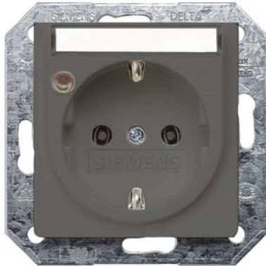
DELTA i-system carbonmetallic SCHUKO Kinderschutz, Betriebsanzeige, Schriftfeld 55x55mm