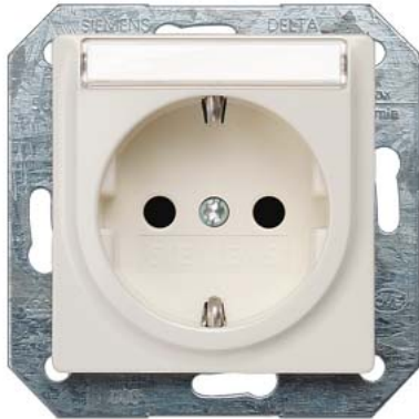
DELTA i-system aluminiummetallic SCHUKO Kinderschutz, Schriftfeld 55x55mm