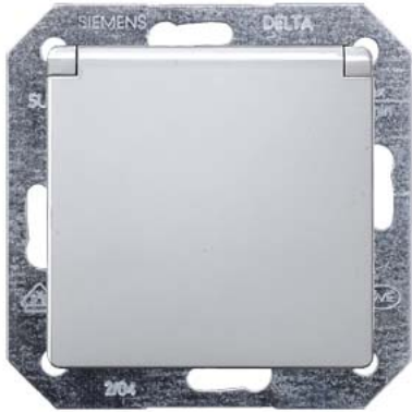
DELTA i-system aluminiummetallic SCHUKO mit Klappdeckel 55x55mm 10/16A 250V