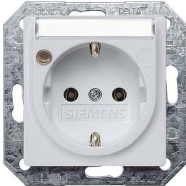
DELTA i-system aluminiummetallic SCHUKO Schrifffeld, Betriebsanzeige 55x55mm 10/16A 250V