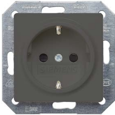
DELTA i-system carbonmetallic SCHUKO mit Kinderschutz 55x55mm 10/16A 250V