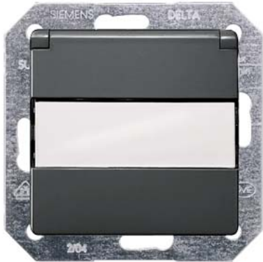
DELTA i-system carbonmetallic SCHUKO mit Klappdeckel, Kinderschutz, Schriftfeld 55x55mm 10/16A 250V