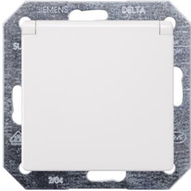
DELTA i-system titanweiß SCHUKO mit Klappdeckel 55x55mm 10/16A 250V