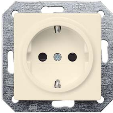
DELTA i-system elektroweiß SCHUKO mit Kinderschutz 55x55mm 10/16A 250V