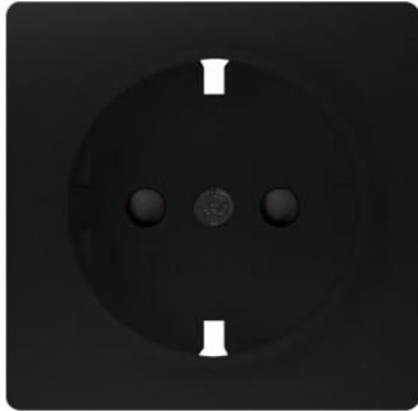
DELTA i-system softschwarz SCHUKO mit Kinderschutz 55x55mm 10/16A 250V