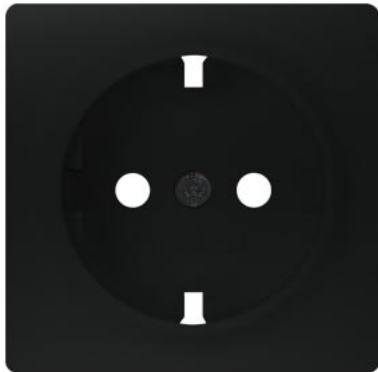
DELTA i-system softschwarz SCHUKO 55x55mm 10/16A 250V