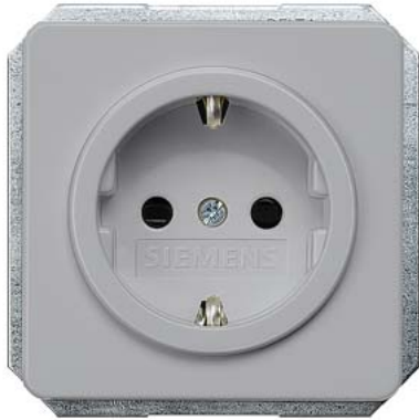
DELTA profil silber SCHUKO mit Kinderschutz 10/16A 250V 65x 65mm