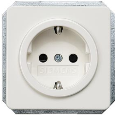
DELTA profil titanweiß SCHUKO mit Kinderschutz 10/16A 250V 65x 65mm