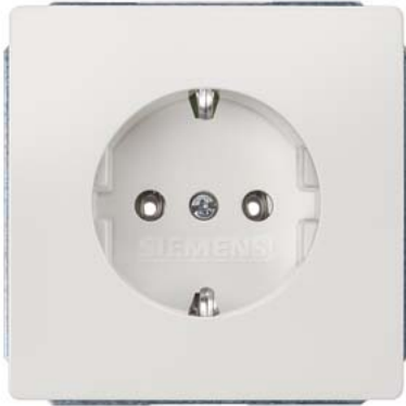
DELTA style titanweiß SCHUKO ohne Krallen 68x68mm 10/16A 250V