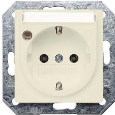
DELTA i-system elektroweiß SCHUKO Schriftfeld, Betriebsanzeige 55x55mm 10/16A 250V