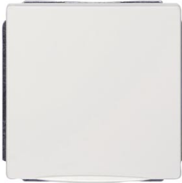
DELTA style titanweiß Abdeckplatte mit Klappdeckel 68x68mm 10/16A 250V